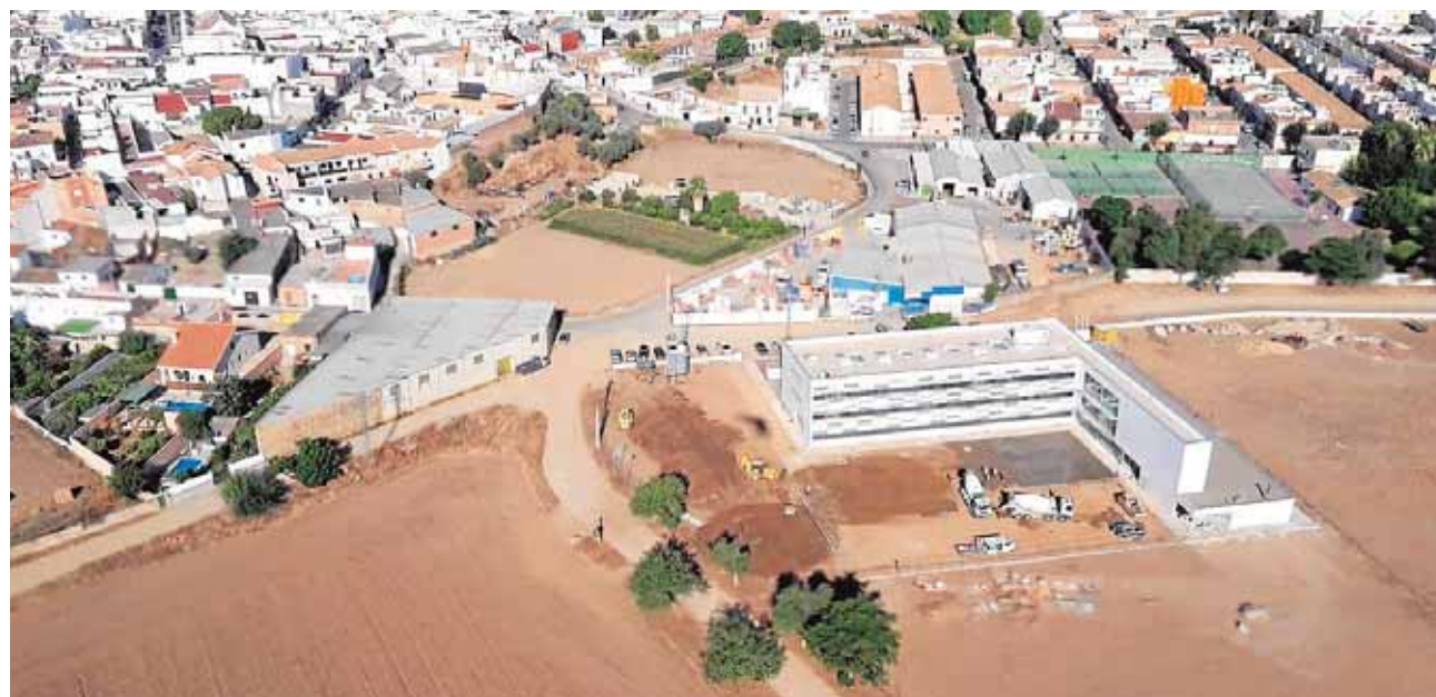
Imagen del nuevo edificio que albergará durante este curso el instituto de Guillena

Efecto dominó El traslado del instituto al nuevo edificio supondrá la ampliación del colegio Andalucía el próximo curso