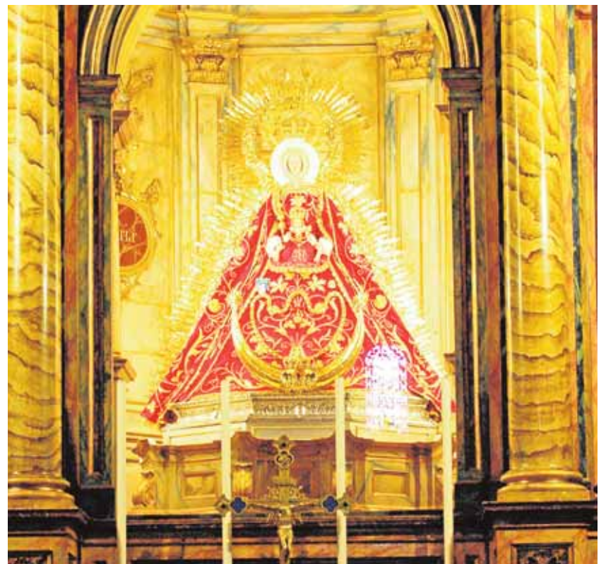
La Virgen de Gracia solo procesiona en ocasiones extraordinarias

La jornada de este domingo comenzará a las 8:30 de la mañana con una misa en Santa María y a su término comenzará la procesión. En primer lugar, la Virgen de Gracia hará una visita obligada, al convento de las Descalzas. El lugar en el que las monjas custodian los ternos de la Virgen. Un conjunto de prendas que siguen la forma y la estética de las damas de corte de los siglos XVII y XVIII. El mejor de ellos, el terno blanco, será el que luzca la Virgen en su salida. Una joya en sentido literal. Junto a los bordados, racimos de perlas y preseas engarzadas formando parte del dibujo de la pieza. Solo con este terno, como se denomina en Carmona al conjunto de su ropa, le bastaría a la Virgen para deslumbrar, pero además se le añaden varias de las joyas más valiosas de su ajuar: el rostro de esmeraldas, la corona, la ráfaga y la media luna. La estampa final es la de una suntuosa dama. Una imagen con una imagen propia inconfun-