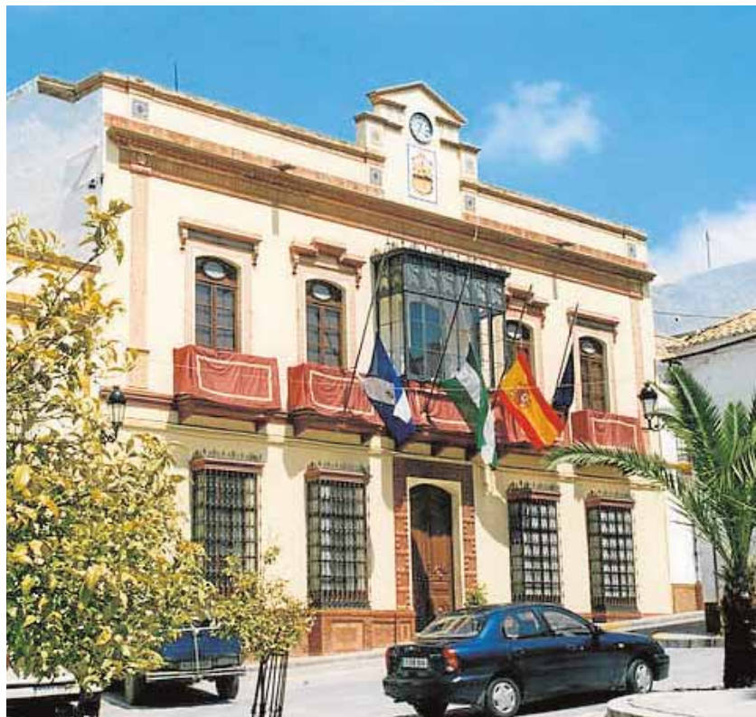
Fachada del Ayuntamiento de Montellano

Así las cosas, los trabajadores, que firman el comunicado al completo, no quieren «soportar el peso de los recortes pagando las sentencias que condenan la mala gestión del Ayuntamiento», y advierten de que acogerse al Fondo de Ordenación no traerá otra cosa que «más endeudamientos, porque este fondo lo que concede es un préstamo». De momento no se prevén manifestaciones u otras iniciativas, pero los trabajadores desean que oigan sus reclamaciones.