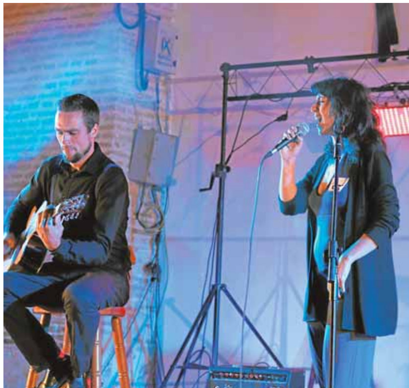
Actuación de «Black and Blue», el pasado martes, en la semifinal

Este acto está organizado por la peña flamenca de Sanlúcar la Mayor, junto con la Delegación de Fiestas del Ayuntamiento, que ha programado diversos espectáculos para todos los públicos. Entre las citas destacarán las actuaciones de chirigotas, orquestas y el concierto de «Los Escarabajos», además de otros espectáculos novedosos que serán algunos de los alicientes para estos tradicionales festejos, que culminarán con la salida procesional del patrón el día 20 de septiembre por las calles del pueblo.