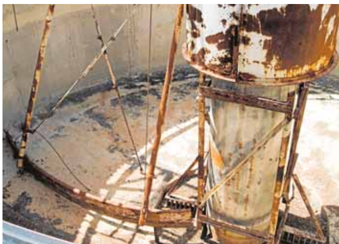
...ran las instalaciones de la depuradora, objeto de robos y actos vandálicos.

tras señalan uno de los múltiples agujeros de la valla de la depuradora.