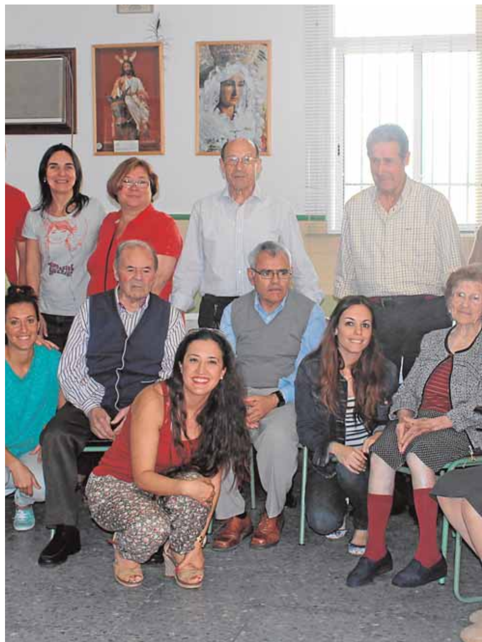
Alrededor de cincuenta enfermos y familiares acuden semanalmente a la sede de Afama.

Afama, ha crecido vertiginosamente en estos casi diez años de vida. Ha pasado de ser un pequeño núcleo de familiares de enfermos que, en palabras del propio Pérez, se enfrentaba «a un vacío absoluto sobre el tema», a un grupo numeroso y activo. En su propia sede ofertan talleres de estimulación, cursos, apoyo psicológico y se encargan cada día de dieciséis pacientes, con diez en lista de espera. Solo este año, además de las próximas jornadas, han firmado varios acuerdos de colaboración con entidades bancarias y organismos públicos para la ampliación de sus actividades y