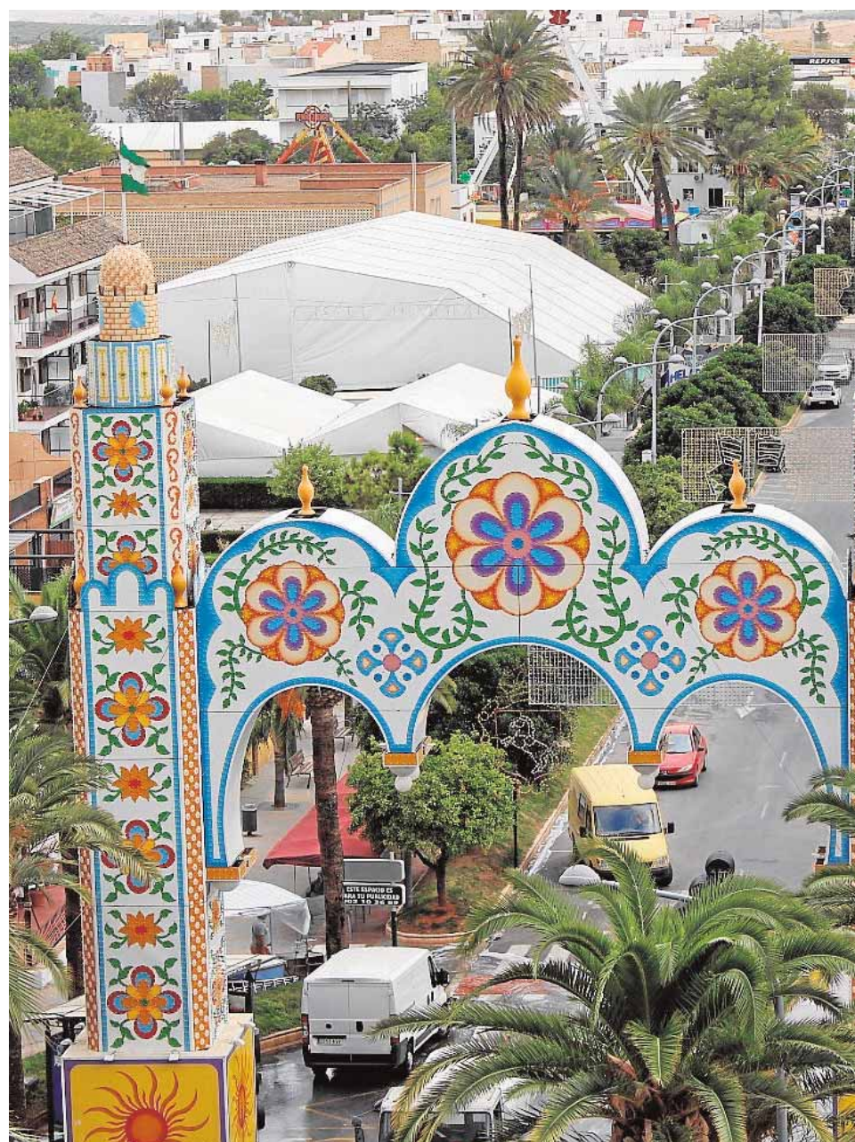
El Arco del Real de la Feria de Morón de la Frontera

Pero no es el único concurso que organiza el Ayuntamiento. No se entiende una Feria sin sevillanas, el baile más emblemático de estas fiestas, por lo que el consistorio también desea premiar a las mejores parejas, academias y grupos de baile que se hayan inscrito en este concurso. Se desarrollará a lo largo de estos días, con varias modalidades. Así, hoy y mañana tendrán lugar parejas de sevillana, con distintas categorías por edad (adultos, juve-